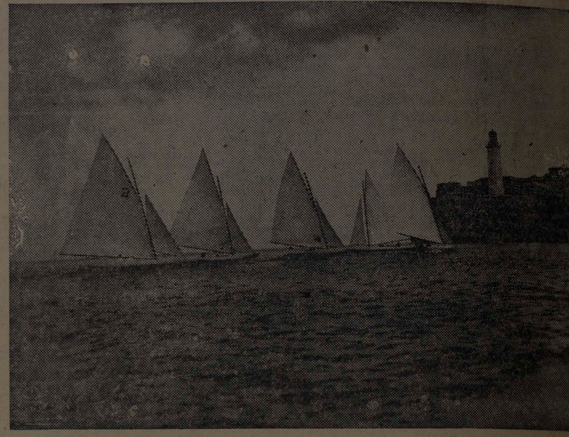
Los balandros al llegar a la boca del puerto.

Con una animación como no esperábamos tuvieron efecto ayer frente al litoral del Malecón, las regatas de yachts a vela, organizadas por el Club Fortuna en este día 1919, discutidas nuevamente en este día en opción al trofeo ofrecido: "Opa Fortuna". Al tercer año de regatas por este premio, concurren embarcaciones anclando las banderas de las instituciones deportivas Havana Yacht Club, Vedado Tennis y Fortuna.