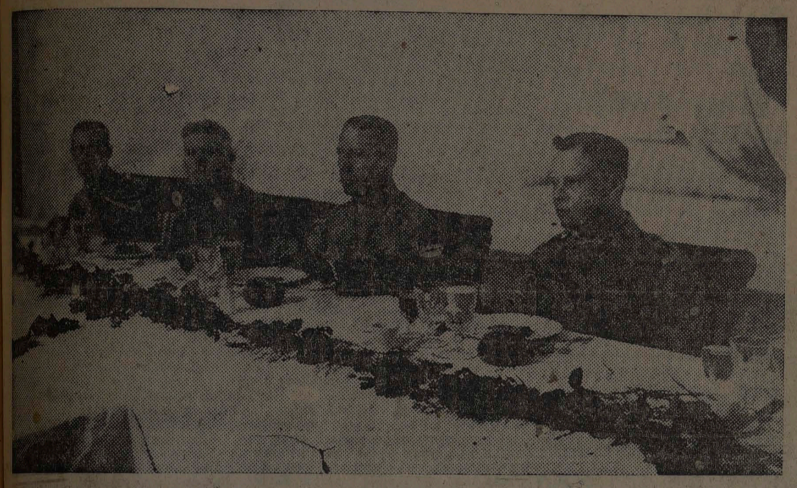
Presidencia del Almuerzo Homenaje al Nuevo Jefe del Estado Mayor del Ejército.

Fué ofrecido por los alumnos de la Escuela de Cadetes